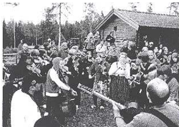
Spelglädje på Ethnolägret!