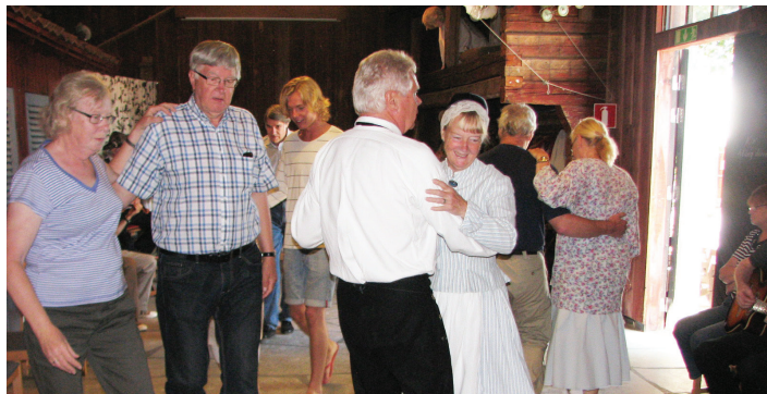
Logdans. Det var stundom trångt inne på danslogen, men humöret var på topp.

Efter olika framträdanden blev det dans på logen och det blev både hambo och schottis så svetten