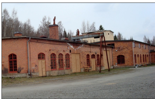
Gruvbacken framför verkstäderna. Här blir en bra scen!